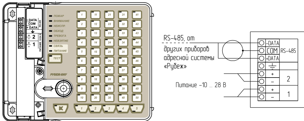
Рисунок 1 - Внешний вид и способ подключения прибора

Состояние индикатора НЕИСПРАВНОСТЬ зависит от состояния зон, ИУ, АМ-Т, НС и насосов.